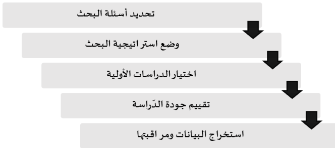
الشكل رقم (2): الأنشطة المنهجية المتبعة في الجانب التطبيقي

أُجريت مراجعة منهجية للأدبيات لتحديد كيف استخدمت البحوث الإدارية العربية مصطلح «Organizational Commitment» أو الالتزام التنظيمي، وذلك بناءً على الإرشادات التي استخدمتها